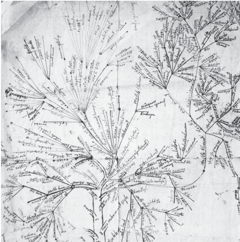
Stamboom uit: Jak den Exter, Sen Kimsin? Voorouders van verre 3 (2008)

sapiens zich vanuit Afrika over de rest van de wereld verspreide. 5